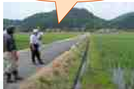
現地確認状況 水稻