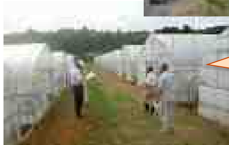
現地確認状況 ホウレンソウ